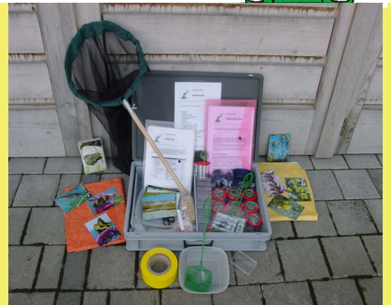
Masse: 60 x 40 x 13 cm, Gewicht: 8,2 kg